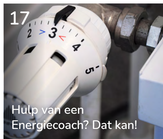
Hulp van een Energiecoach? Dat kan!