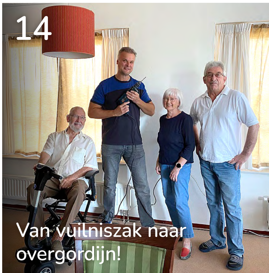
Van vuilniszak naar overgordijn!