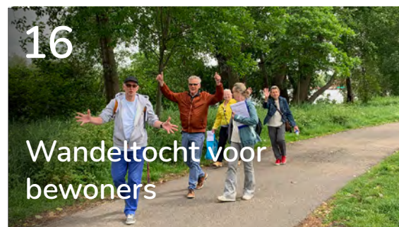
Wandeltocht voor bewoners